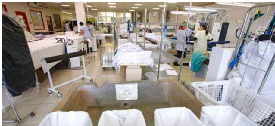
Un nouveau groupement de commande pour le lavage des vêtements de travail est en cours de consultation. Toutes les communes peuvent y adhérer.

Seul on va plus vite, ensemble on va plus loin ! Tel pourrait être l'adage qui accompagne le Groupement de commande mis en place par Grand Besançon Métropole il y a plusieurs années déjà. Derrière ce dispositif, une attente forte des élus, celle de réduire les coûts en mutualisant les commandes de services ou produits dont tous les partenaires peuvent avoir besoin. Pour formaliser ce projet, Grand Besançon Métropole a donc mis au point une convention cadre du groupement de commandes permanent (niveau 1 du service de l'aide aux communes). Aujourd'hui, 86 membres ont scellé cet accord (les 68 communes, GBM et les structures partenaires) qui a d'autres intérêts que le gain financier. Encadré par les experts administratifs et techniques de GBM, ce dispositif permet de simplifier le mécanisme de groupement de commandes mais aussi de sécuriser juridiquement les achats. Après consultation des élus, deux besoins ont été identifiés comme prioritaires. Ci-dessous les caractéristiques de ces deux nouveaux groupements de commande :